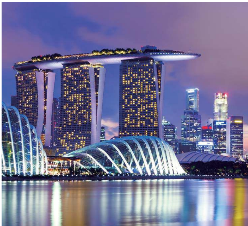
新加坡滨海湾金沙酒店