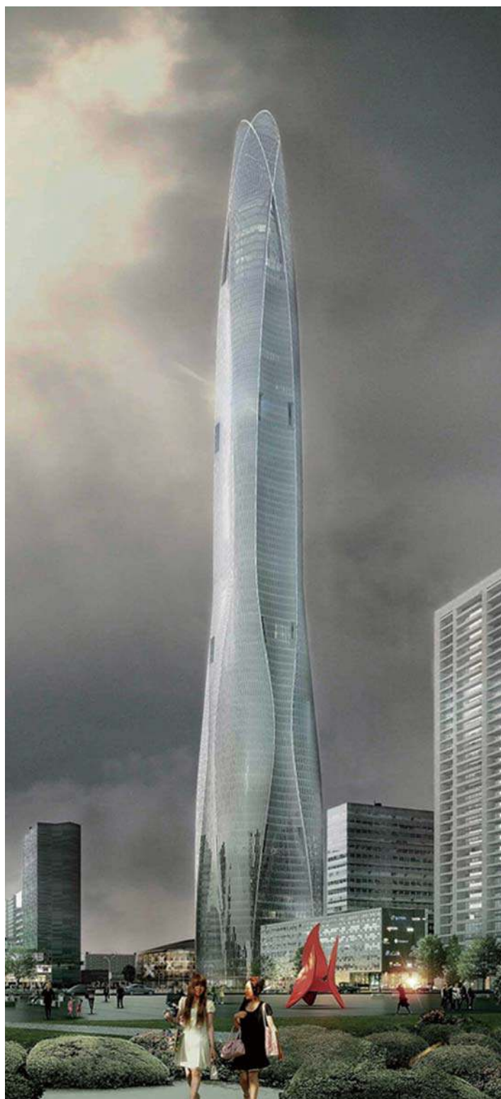
天津周大福金融中心