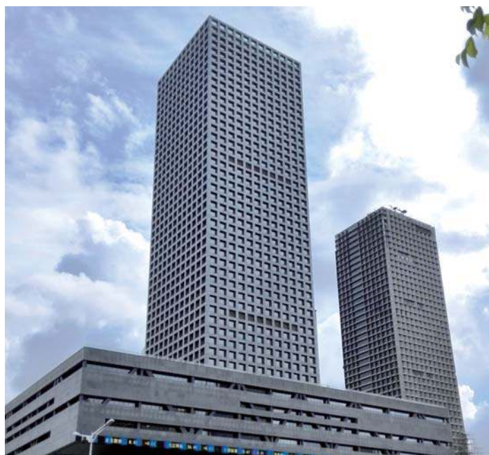
深圳证券交易所 中国深圳