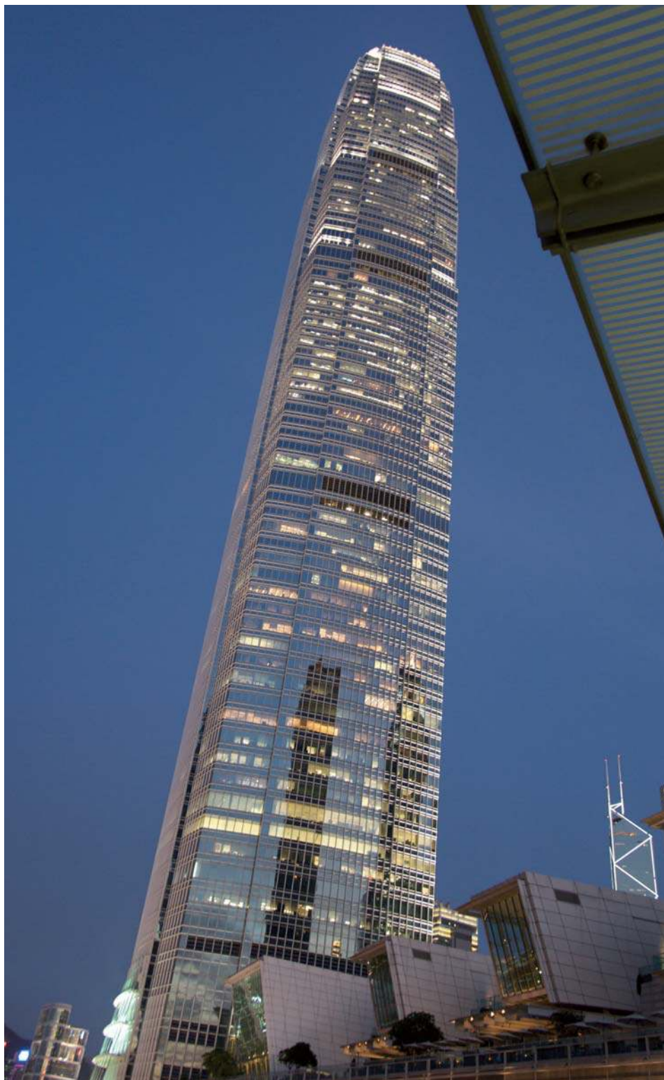
国际金融中心二期