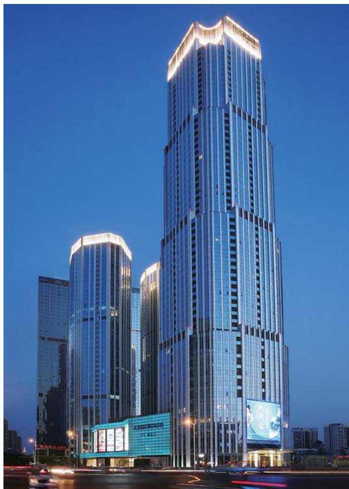
天津国际贸易中心1号楼