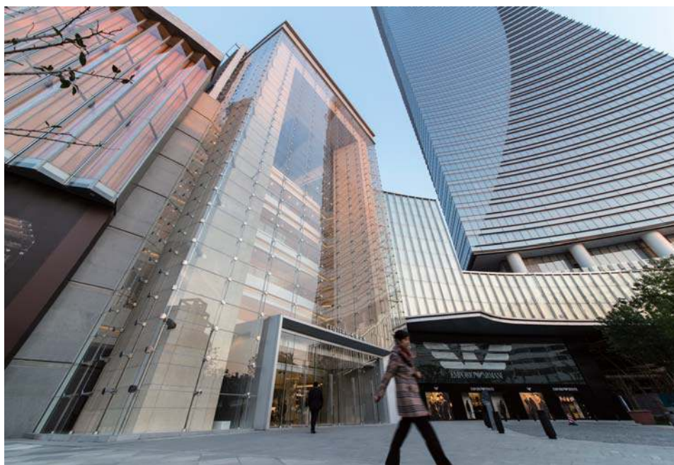
无锡恒隆广场办公楼1号楼