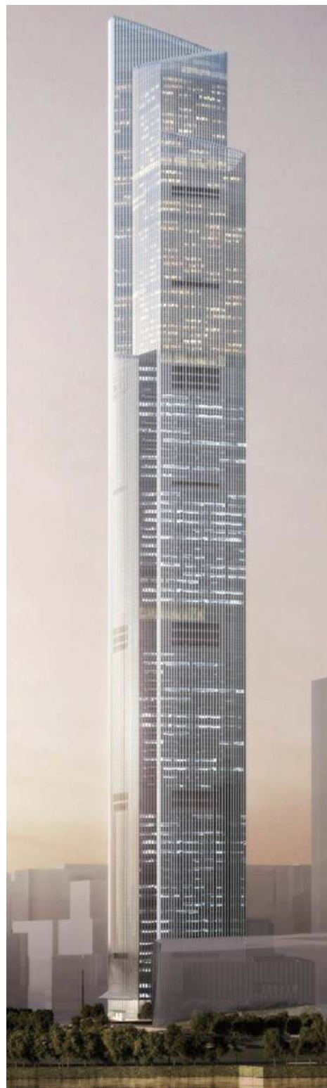
广州周大福金融中心