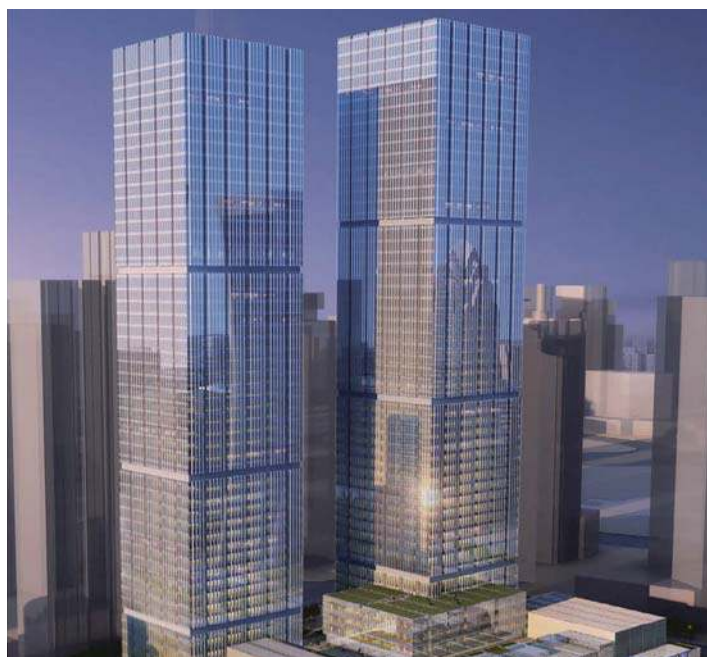
中信瑞博大厦1号及2号楼