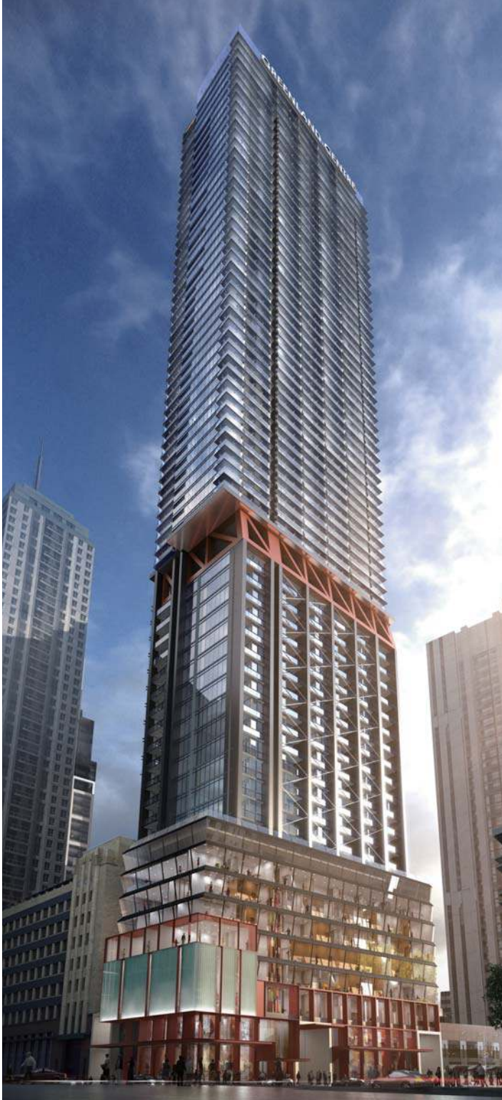
绿地中心 澳大利亚悉尼